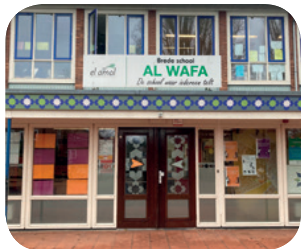
Basisschool Al Wafa in Amsterdam-West.