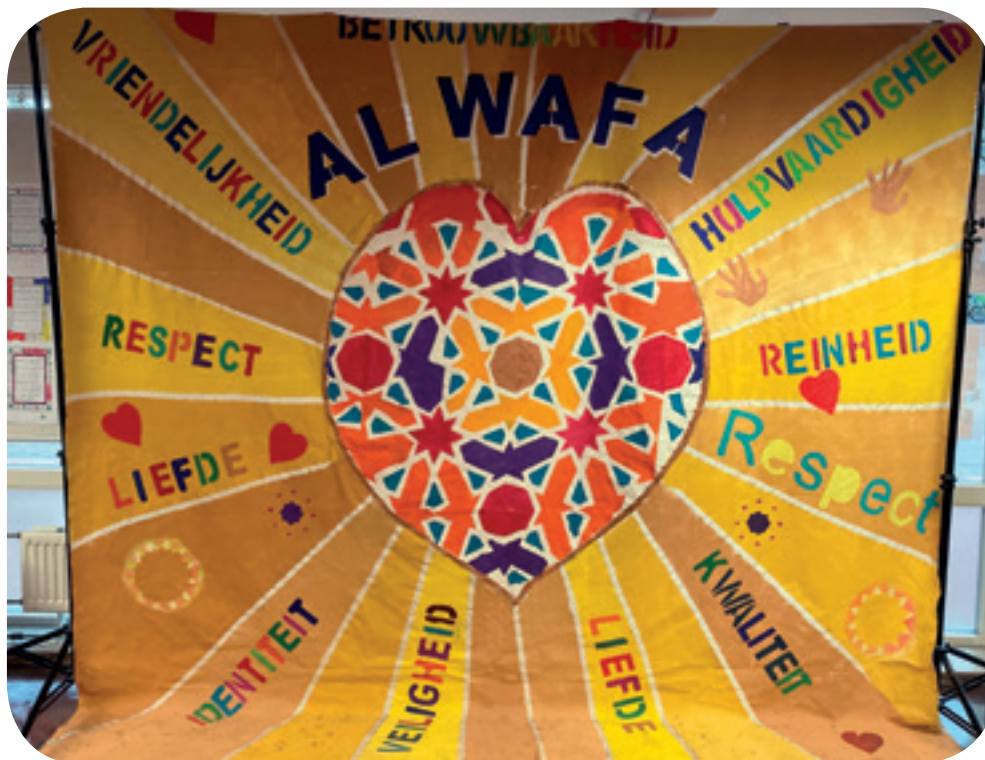
Dit doek, met de belangrijke waarden van de school, is gemaakt door de ouders van de leerlingen van Al Wafa.